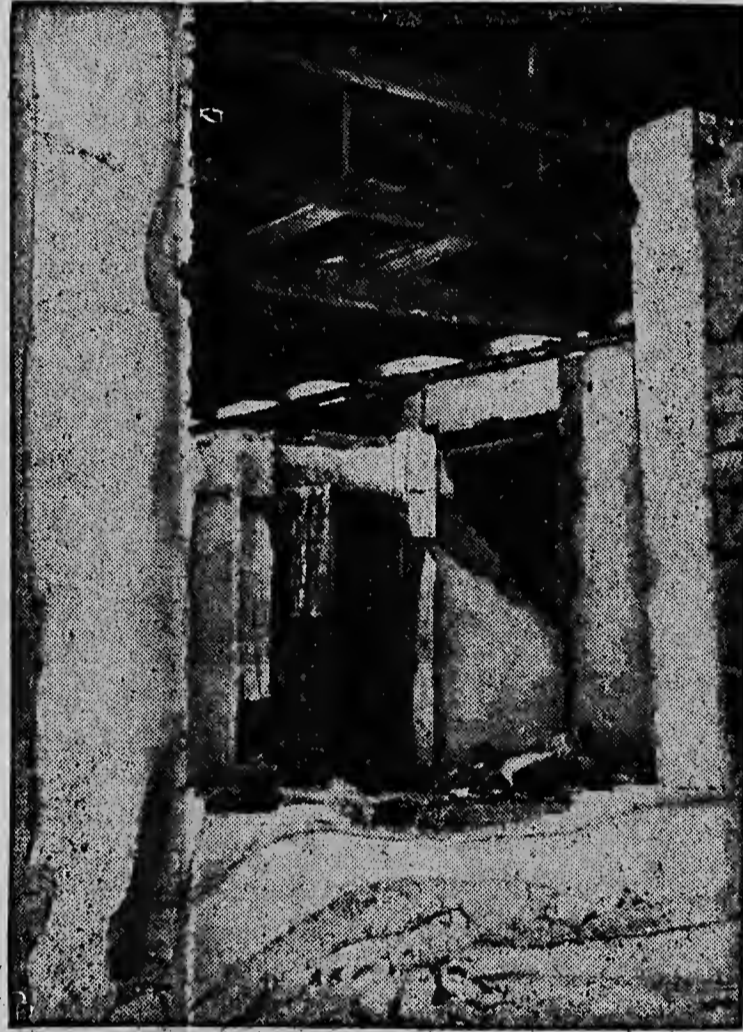
De stad Yajalon in Mexico werd bijzonder zwaar getroffen door de aanhoudende aardbevingen, welke het land verleden week en ook gisteren weer teisterden. Een geluk is het, dat in deze stad vele gebouwen van steen zijn. Hierdoor bleven vele daken staan en bleef het aantal persoonlijke ongevallen laag.

Ieder, die een stuk vaatwerk breekt, wordt automatisch gediskwalificeerd.